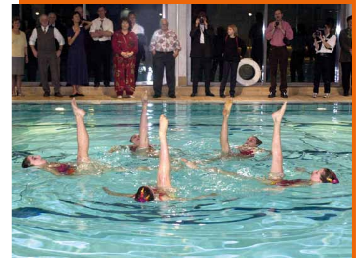
Wasserballett zur Eröffnung des Titanias am 15. März 2001.

100 Jahre Bismarckturm Steppach – 1901 erfolgte die Grundsteinlegung und 1905 die Einweihung.