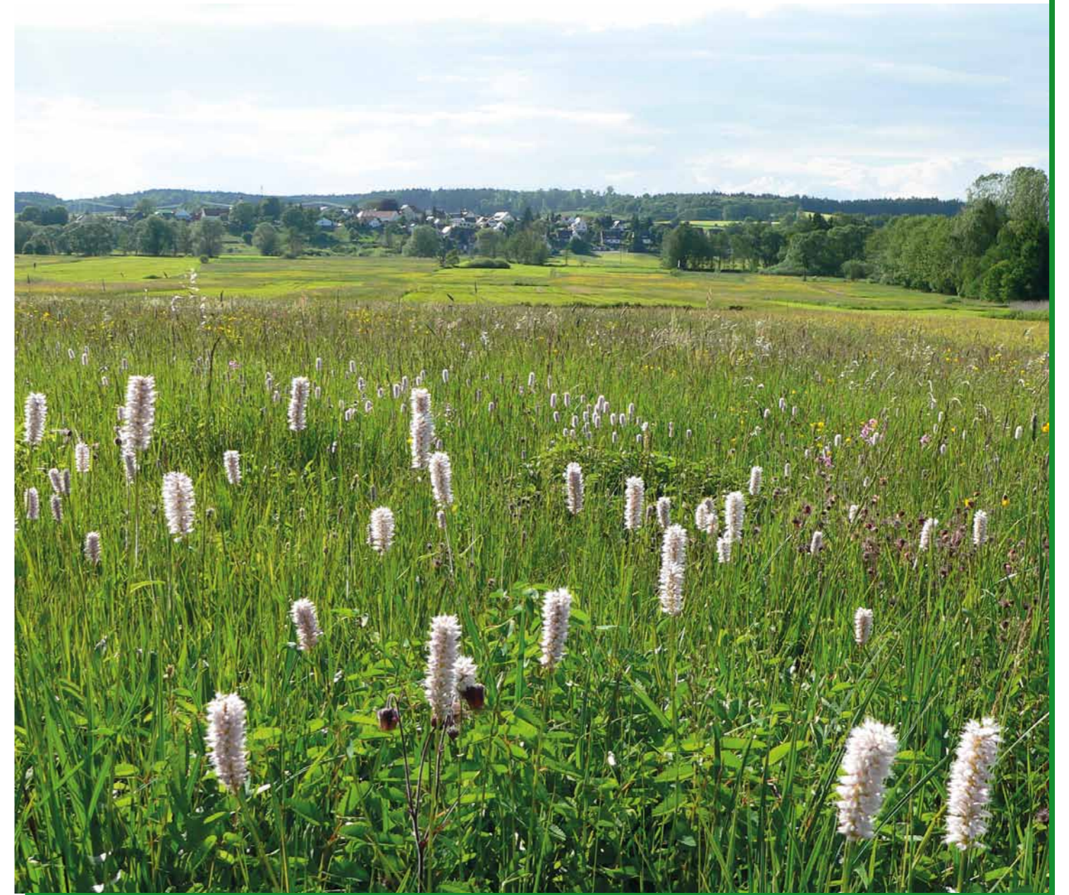
Der Wiesenknöterich blüht im Schmuttertäl bei Vogelsang.

Finanzielle Förderung: Bayerischer Naturschutzfonds, Regierung von Schwaben, Untere Naturschutzbehörde am Landratsamt Augsburg.