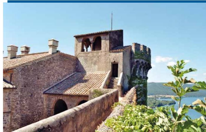
Ausblick von den Zinnen der Burg über den Vulkansee „Lago di Bracciano“.

essante Luftfahrtmuseum; besucht wurde natürlich auch das eindrucksvolle Passionsfestspiel am Karfreitag und bei einer Tagesfahrt nach Rom wurden die allerwichtigsten Sehenswürdigkeiten gestreift, wobei es auf der Piazza vor der päpstlichen Lateranbasilika zu einem spontanen Treffen mit der zeitgleich in Bracciano weilenden Jugendgruppe aus Neusäß kam.