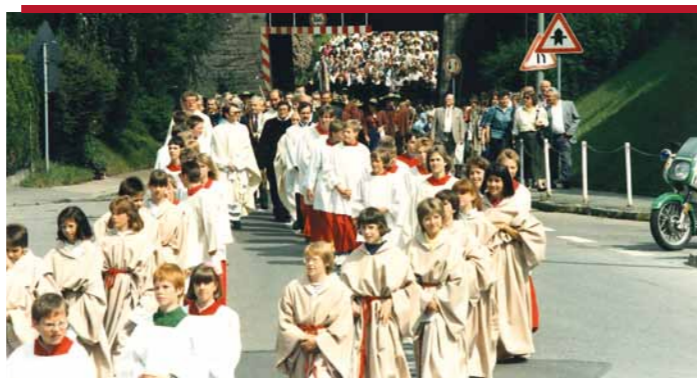
Prozession zum Festgottesdienst der katholischen Neusässer Pfarreien (12. Juni 1988) im Rahmen der Feierlichkeiten zur Stadterhebung.

Der Höhepunkt des ausgedehnten Festes kam am Sonntag. Nach Festgottesdiensten und der kirchlichen Weihe von Rathaus und Stadthalle, setzte sich um zwei Uhr nachmittags ein gewaltiger Festzug mit fast 5.000 Mitwirkenden in Bewegung. Gruppen und Musikkapellen aus allen Teilen Bayerns, aus Baden-Württemberg, dem Saarland und Österreich waren ebenso vertreten wie die Abordnungen und Festwagen der Neusässer Vereine. Von der Knappenkapelle Penzberg, einer Schalmeykapelle aus Saarbrücken, einer alten Schmiede und einer Beduinentruppe zu Pferd bis hin zum Prunkwagen der Narneusia war alles vertreten. Alle acht Neusässer Stadtteile wie auch Gewerbetreibende und Landwirte hatten ihre eigenen, mit viel Mühe und Liebe gestalteten Festwagen. 70 Neusässer Vereine waren aktiv dabei. So zeigte gerade der Festzug eine breite Zustimmung der Bürgerschaft zur neuen Stadt. Unter den 30.000 Zuschauern waren auch Bürgermeister und Stadträte der befreundeten Stadt Redwood Falls in Minnesota, USA.