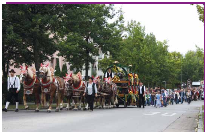
Auftakt zum Neusässer Volksfest mit Festumzug zum Festplatz.