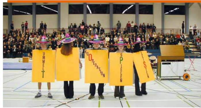
Einweihung der neuen Dreifachturnhalle „Am Eichenwald“, 25. Januar 2002.

Wurde zum 10-jährigen Bestehen der Städtepartnerschaft zwischen Markkleeberg und Neusäß im Ägidiuspark errichtet: ein Gedenkstein.