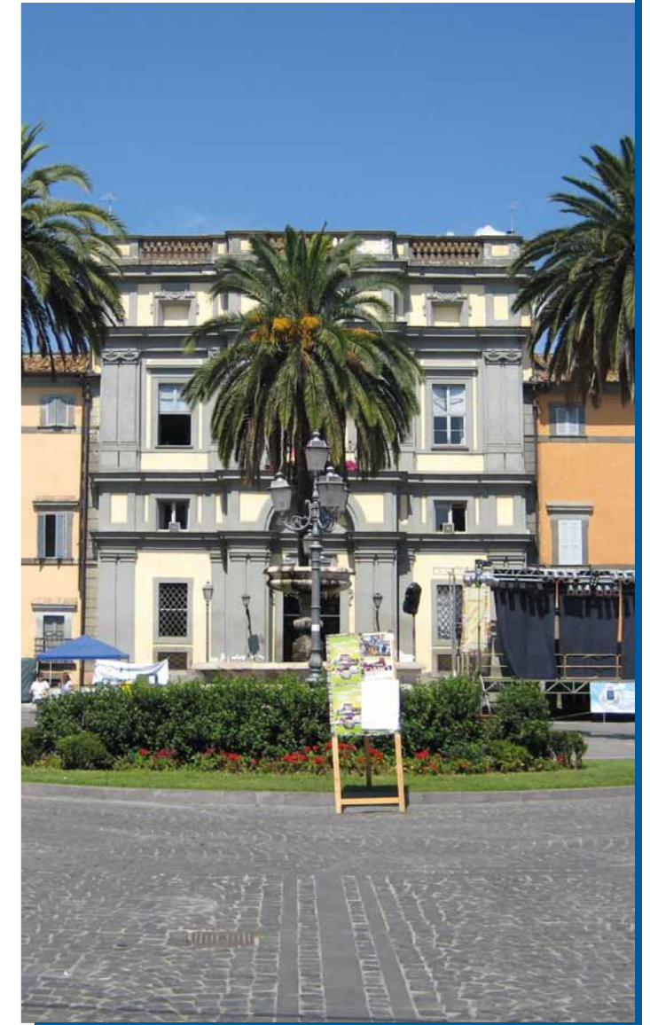
Rathaus Bracciano mit Piazza IV Novembre.