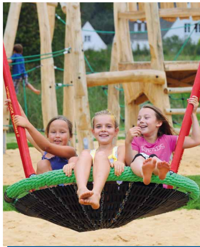
Heiß begehrt auf jedem Spielplatz – die Vogelnestschaukel.

Damit Kinder ihre ersten Schritte unbelastet setzen können, hat die junge Stadt Neusäß vom Zeitpunkt der Stadterhebung an, neben dem Ausbau eines vielfältigen Betreuungsangebots erkennbar auf die Ausgestaltung des Leitbilds einer familien- und kinderfreundlichen Kommune mit wohnortnahen Spiel- und Aufenthaltsbereichen geachtet. Als Kriterium für eine entsprechende Stadtplanung gelten schöne Bewegungsräume, etwa Grünflächen und Fußgängerbereiche, die Nähe zu Kindergärten, Schulen und Sportanlagen und vor allem eine hohe Dichte an qualitativollen Kinderspielplätzen.