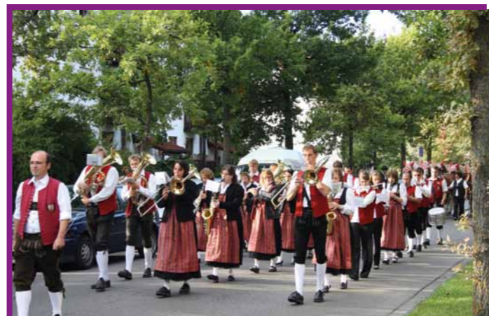
Gehört zu jedem Volksfestumzug mit dazu: die Stadtkapelle Neusäß.

Nicht nur echte Pferde, sondern auch Pferdestärken gab es beim Festumzug zum Neusässer Volksfest 2012 mit den Oldtimer-Schlepperfreunden Schmuttertäl-Neusäß e.V.